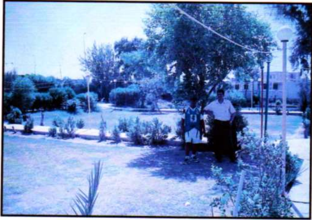
صورة رقم (٢) جانب من حديقة العاب المسبح

٤- مدينة العاب المسبح : وهي حدائق ومسبح صيفي تعود ملكيتها الى نادي ديالى الرياضي ومؤجرة للقطاع الخاص تبلغ مساحتها (١٠٠٠٠)م ٢ وحالياً تؤدي وظيفتها ككازينو ومطعم للعوائل وللمناسبات الاجتماعية كحفلات الزفاف وكذلك تم اعادة النشاط للمسبح الصيفي وتضم حدائقه وسائل متنوعة للعب الاطفال (تنظر صورة رقم ٢) .