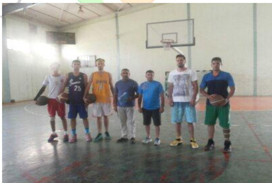
قسم من العينة