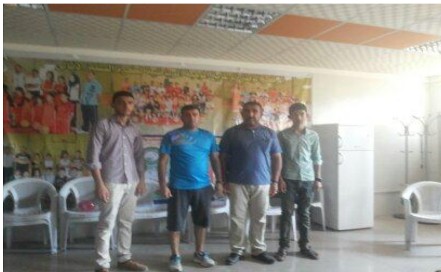
فريق العمل المساعد