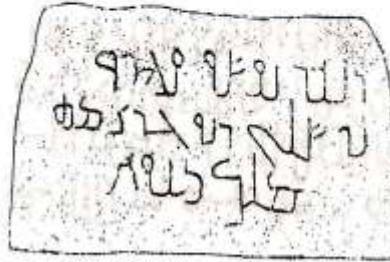
ملحق رقم ( ١ )

نقش أم الجمال : وقد عثر على هذا النقش الحجري في أم الجمال وتقع في جنوب حوران من أعمال شرق الأردن • وهو يعود لقبر عمر بن سلمي مربي جذيمة ملك تتوخ الذي غاصر الملكة الزباء • وقد كتب بالخط النبطي المتأخر وتاريخه نحو ٢٥٠ ب.م.