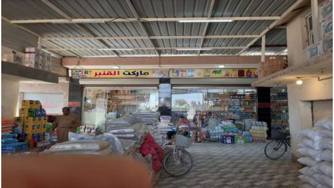
صورة (٤) محال الجملة في ناحية السد العظيم

تنشأ الخدمات التجارية حيثما توجد اي كثافة سكانية في اي بقعة من الارض صغيرة كانت ام كبيرة اذ لا توجد مدينة مهما صغر حجمها الا ويحتل هذا الاستعمال فيها حيزا مكانيا بل يتعدى الامر إلى المستقرات الريفية ، حيث نلاحظ بعض المحال تنتشر في بعض القرى الكبيرة ، وما يميز هذا الاستعمال التجاري الاخير صغر المساحة التي ينشئ عليها البناء، وسبب ذلك انه لا يقوم الا بخدمة القرية التي هو فيها مما يجعله قليل الاهمية بالنسبة للقرى المجاورة له . لقد بلغت مساحة الخدمة التجارية في ناحية السد العظيم ( 5179)م ٢ من مساحتها الكلية وبنسبة ( 0,08 )% موزعه على محال البيع بالجملة والمفرد منتشرة على الشوارع الرئيسية والفروع كما هو ملاحظ في الصورة (٤).