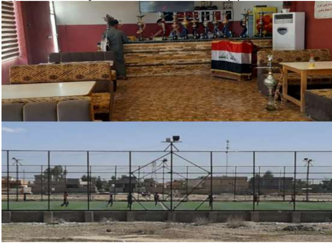
المصدر : دراسة ميدانية بتاريخ ٢٥ / ٣ / ٢٠٢١

تعد منطقة البحث فقيرة من الناحية الترفيهية المتمثلة بالحدائق والمنتزهات مقارنة بالكثافة السكنية التي تحتاج لهذه الخدمة الترويحية لإعادة نشاطهم وحيويتهم ، اذ شكلت مساحة قدرها ( 12,100 ) م ٢ من مساحة المدينة حيث بلغت نسبتها ( 0,19 ) % من مساحة الخدمات في الناحية المتضمنه المنتزهات والاشرطة الخضراء اضافة إلى ملعب رياضي خماسي نادي ترفيهي للشباب ( كوفي شوب ) صورة (٧) ، الا ان هذه الارقام مجرد مساحات تتصف بالنقص الكبير من حيث التجهيز قياساً بالواجب المفترض من الاستعمال الترفيهي للأرض . صورة (٧) تمثّل الخدمات الترفيهية في ناحية السد العظيم